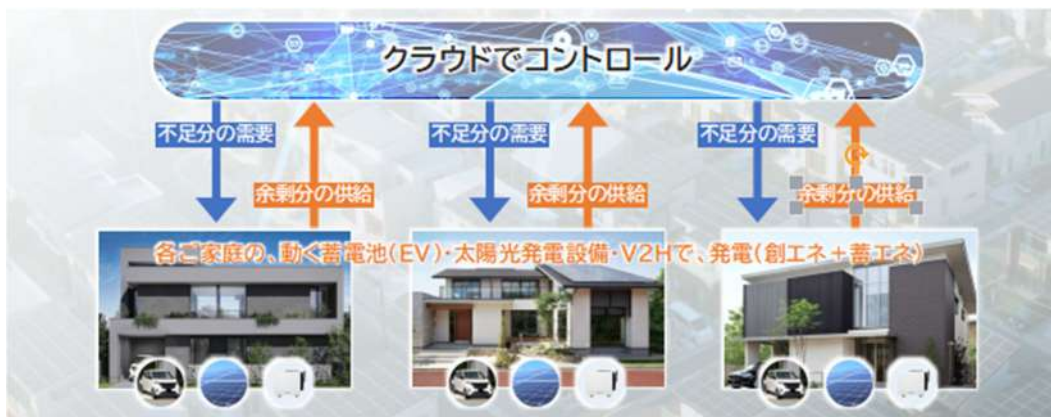
▲各ご家庭で 10kw 発電、1,000 棟で 10,000kw の電力が調整可能。 ※小型の水力発電所 1 基分の発電量と同等

地球温暖化に貢献し地球環境に優しい YAMADA スマートハウスが、未来の子供たちへ安心を提供します。